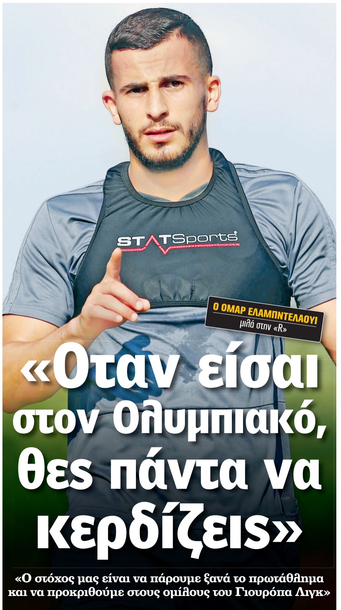
Ο ΟΜΑΡ ΕΛΑΜΠΝΤΕΛΑΟΥΙ μιλά στην «R»

«Όταν είσαι στον Ολυμπιακό, θες πάντα να κερδίζεις»