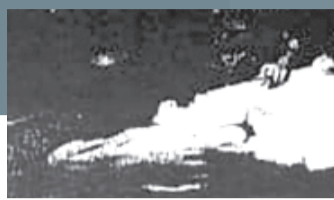
Συνάντηση του αστυνομικού διευθυντή με δύο απόσπρατους της ΕΛ.ΑΣ. σε ξενοδοχείο του κέντρου