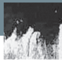
Αμέσως μετά τη συνάντηση στο ξενοδοχείο, ραντεβού με δύο εν ενεργεία αστυνομικούς σε πάρκο πηλίσον του Καλλιμάρμαρου