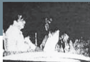
Συναντήσεις σε πάρκο πηλίσον της οδού Πευκών (Φιλοθέη) κάθε 15 ημέρες