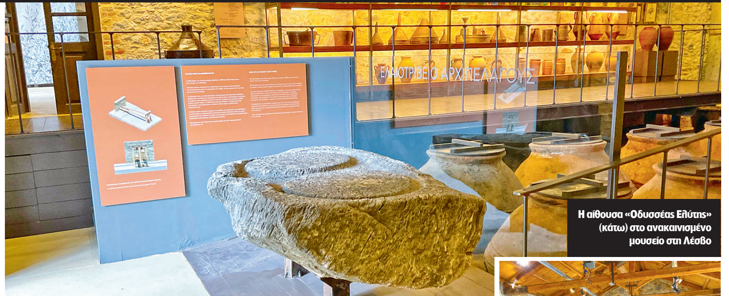
Η αίθουσα «Οδυσσέας Ελύτης» (κάτω) στο ανακαινισμένο μουσείο στη Λέσβο

Η αναστήλωση, η αποκατάσταση και η μετατροπή του παλαιότερου ατμοκίνητου ελαιοτριβείου του Αιγαίου -ανακρυγμένου ως διατηρητέου- σε μουσείο χαρακτηρίζονται ως πρότυπο αναστηλωτικό έργο, σε ένα σημαντικό