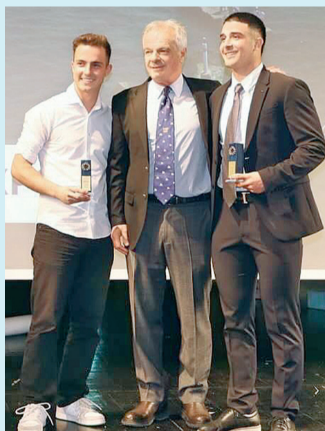
ΣΤΙΓΜΙΟΤΥΠΟ από τη βράβευση διακριθέντων αθλητών