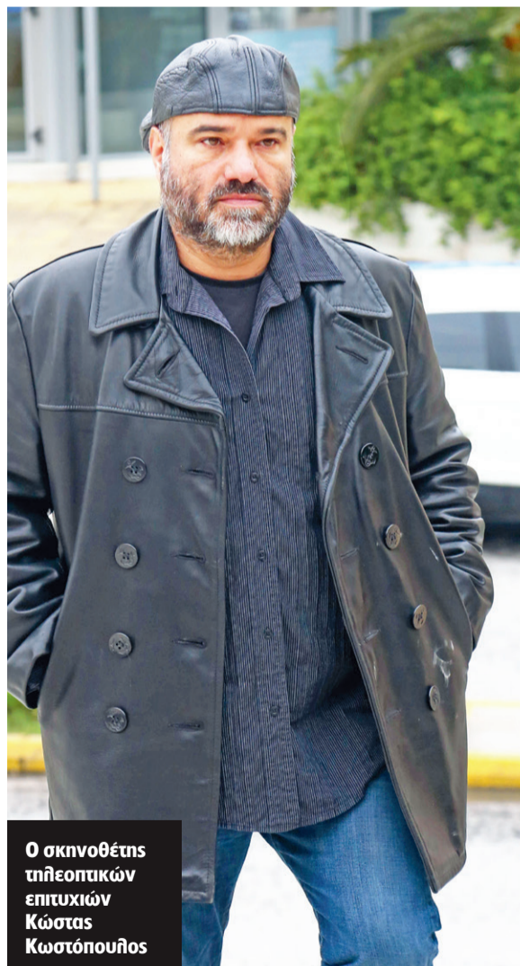
Ο σκηνοθέτης τηλεοπτικών επιτυχιών Κώστας Κωστόπουλος

Την παραπομπή του Κώστα Κωστόπουλου σε δίκη για το αδίκημα του βιασμού προτείνει με απόφασή της η εισαγγελέας Πρωτοδικών, Ελένη Παπαδοπούλου