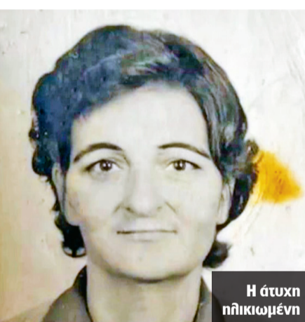
Η άτυχη ηλικιωμένη