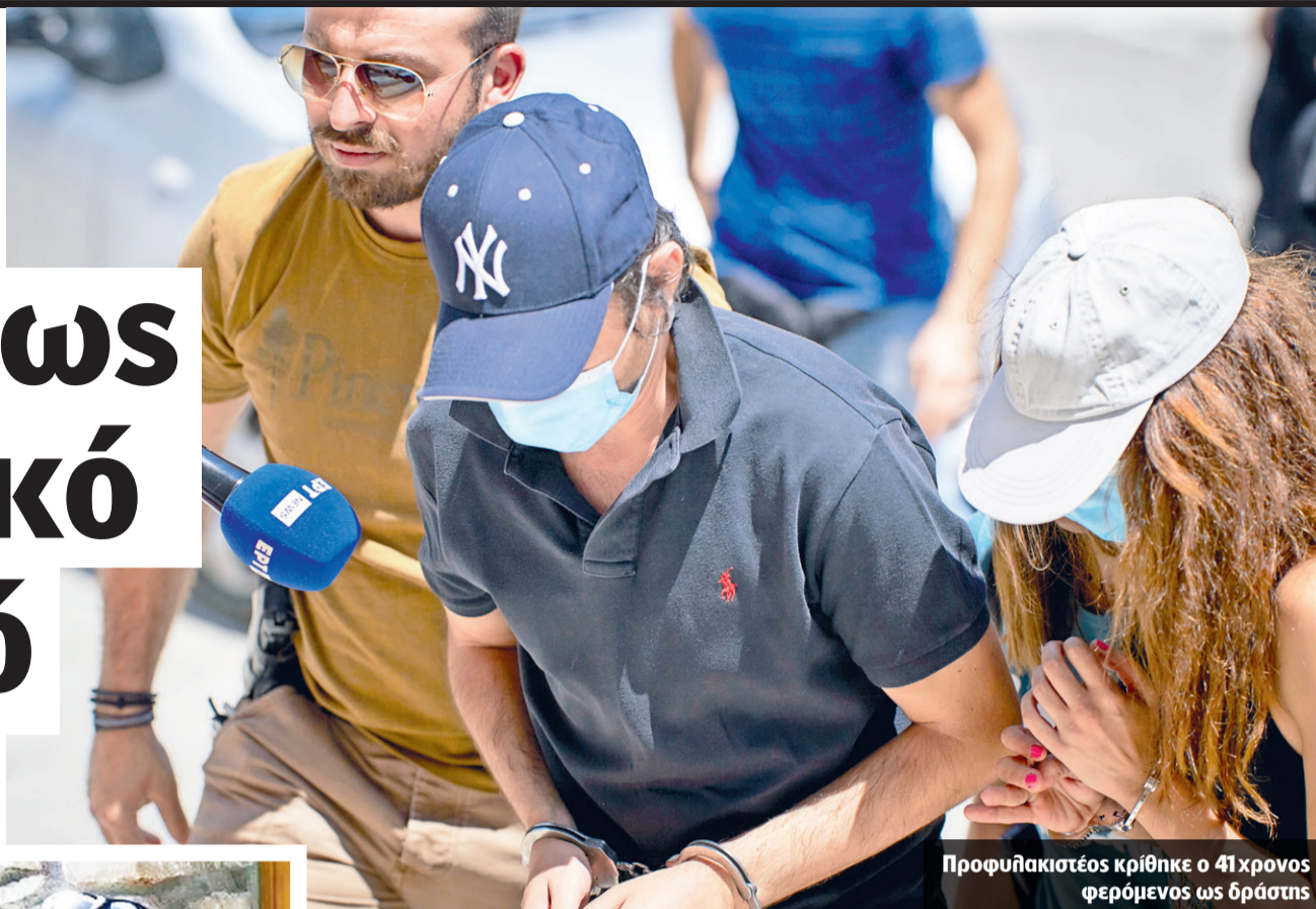
Προφυλακιστέος κρίθηκε ο 41χρονος φερόμενος ως δράστης

Οι φερόμενοι ως δράστες και το θύμα γνωρίζονταν φυσιολογικά, καθώς ήταν συγχωριανοί. Στο παρελθόν δεν είχαν προστριβές μεταξύ τους, ενώ τόσο ο 41χρονος όσο και η 34χρονη, σύμφωνα με όλες τις πληροφορίες, ήταν φιλόσοχοι άνθρωποι και δεν είχαν ασχοληθεί ποτέ τις Αρχές. Μαρτυρίες συγχωρι-