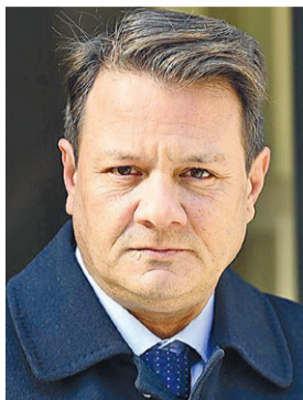
Ο ποινικολόγος Απόστολος Λύτρας

Ήταν «φως φανάρι» ότι ο ύπαρχος θα έριχνε τον 36χρονο στη θάλασσα, κατέθεσε ο Δ.Δ., άλλος επιβάτης του «Blue Horizon» που βρισκόταν στο εξωτερικό κατάστρωμα στο πίσω μέρος του πλοίου την ώρα του απόπλου. «Ξαφνικά ακούω φωνές από τον κόσμο γύρω μου και βλέπω ένα άτομο σίγουρα από το πλήρωμα, το οποίο φορούσε λευκό πουκάμισο με διακριτικά στους ώμους να σπρώχνει νεαρό άνδρα με σκούρο πουκάμισο από τον καταπέλτη την ώρα που ξεκινούσε το πλοίο. Εγιναν τρεις απωθήσεις από τον συγκεκριμένο ναυτικό στις προσπάθειες του νεαρού να μπει στο πλοίο. Μόλις ο καταπέλτης άρχισε να φεύγει από τον ντόκο, όλος ο κόσμος στο πίσω κατάστρωμα φώναζε γιατί ήταν φως φανάρι ότι θα έριχνε στη θάλασσα τον νεαρό, ακριβώς γιατί το πλοίο