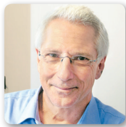
γράφει ο ΘΑΝΑΣΗΣ ΔΙΑΜΑΝΤΟΠΟΥΛΟΣ*

Ο ΜΕΤΡΙΟΠΑΘΗΣ αλλά ακραιφνής αντιβενιζελικός Γεώργιος Πεσμαζόγλου αφηγείται το εξής στα απομνημονεύματά του: Ευρισκόμενος με άλλους παράγοντες του αντιβενιζελισμού στην οικία του Ιωάννη Μεταξά το βράδυ της πρώτης αποπομπής Βενιζέλου, τον Φεβρουάριο του 1915, είδε να καταφθάνει -συμπεριφορά, ασφαλώς, όχι ιδιαίτερα θεσμική- ο βασιλιάς Κωνσταντίνος. Αμέσως τους ανακοίνωσε την πρόθεσή του να κάνει πρωθυπουργό τον Γούναρη. Διαπιστώνοντας, δε, με έκπληξη ότι ο Μεταξάς δεν έδειχνε ούτε από αυτή την εξέλιξη ικανοποιημένος, τον ρώτησε γιατί. Και αυτός απάντησε: «Μεγαλειότατε, εκεί όπου έφτασαν τα πράγματα, δύο λύσεις υπάρχουν. Ή να συμφωνήσετε με τον Βενιζέλο και να προσπαθήσετε, εν συνεχεία, να μειώσετε τις δυσάρεστες συνεπειές που θα έχη η συμμετοχή μας εις τον πόλεμον άνευ των απαιτούμενων εξασφαλίσεων ή να εκλείψη ο Βενιζέλος».