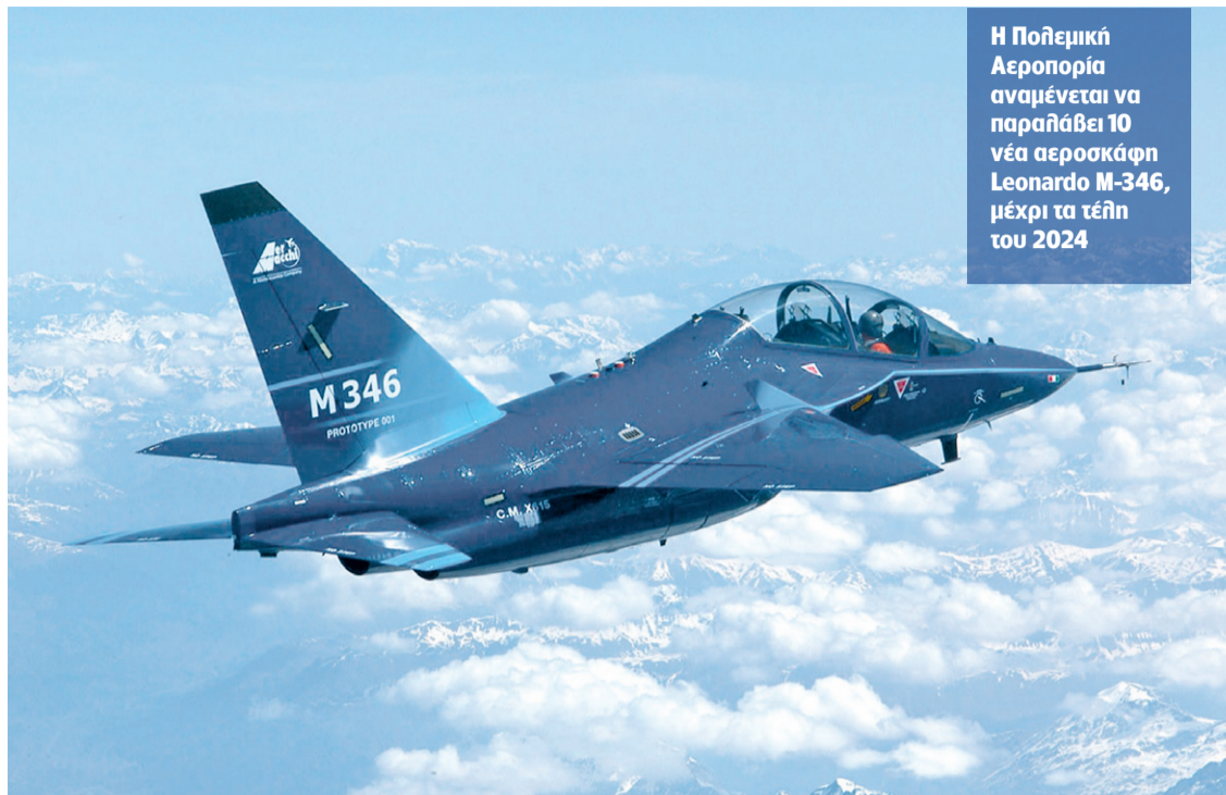
Η Πολεμική Αεροπορία αναμένεται να παραλάβει 10 νέα αεροσκάφη Leonardo M-346, μέχρι τα τέλη του 2024

Ως πιθανότερο αίτιο του δυστυχήματος προκρίνεται αυτό που επισήμως ονομάζεται «δομική καταστροφή λόγω κόπωσης (σ.σ. παλαιότητας) του υλικού»