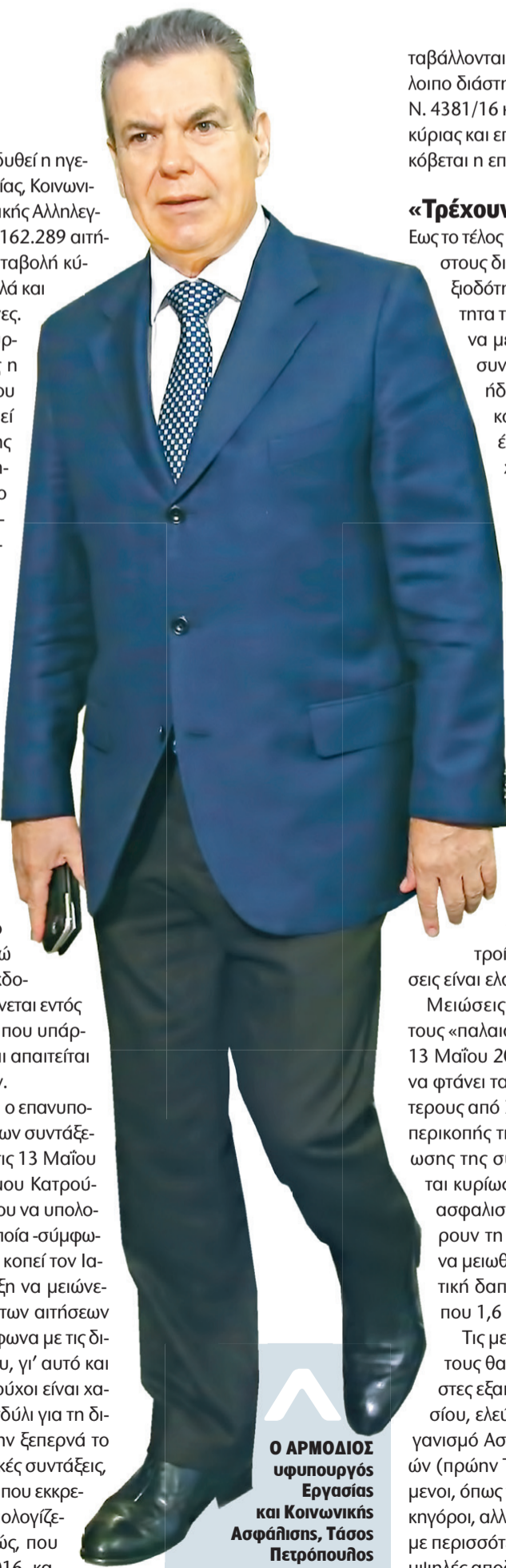
Ο ΑΡΜΟΔΙΟΣ υφυπουργός Εργασίας και Κοινωνικής Ασφάλισης, Γάσος Πετρόπουλος

Παράλληλα, ολοκληρώνεται και ο επανυπολογισμός των ήδη καταβαλλόμενων συντάξεων που έχουν εκδοθεί πριν από τις 13 Μαΐου 2016 και την εφαρμογή του νόμου Κατρούγκαλου (Ν. 4381/16), προκειμένου να υπολογιστεί η προσωπική διαφορά, η οποία -σύμφωνα με το μνημόνιο- θα πρέπει να κοπεί τον Ιανουάριο του 2019, με τη σύνταξη να μειώνεται έως και 18%. Η πλειονότητα των αιτήσεων σε αναμονή θα υπολογιστεί σύμφωνα με τις διατάξεις του νόμου Κατρούγκαλου, γι' αυτό και τα ποσά που θα λάβουν οι δικαιούχοι είναι χαμηλότερα, με αποτέλεσμα το κονδύλι για τη διεκπεραίωση των αιτήσεων να μην ξεπερνά το 1 δισ. ευρώ. Ειδικά στις επικουρικές συντάξεις, καθώς υπάρχουν και περιπτώσεις που εκκρεμούν από το 2014, η σύνταξη υπολογίζεται με το προηγούμενο καθεστώς, που ίσχυε μέχρι τις 12 Μαΐου του 2016, κα-